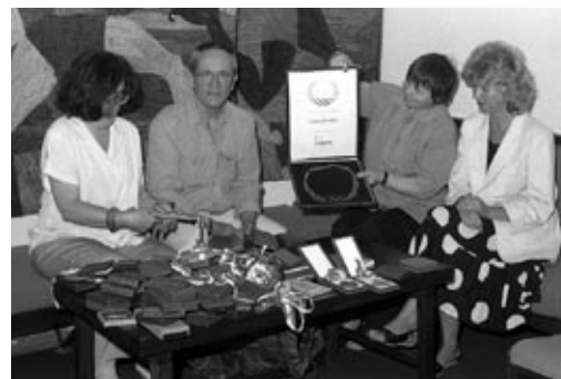
Waldemar Baszanowski z pracownikami Muzeum podczas przekazywania swoich trofeów do zbiorów Muzeum, 12.08.1993.

Jakież było nasze zdziwienie, kiedy niebawem pojawił się w Muzeum niezapowiedziany i zasmucony. Bardzo przeproszał za kłopot i zapytał „czy może zmienić decyzję?”. Okazało się, że Mistrz nie konsultował ze swoją najbliższą rodziną spontanicznej decyzji o przekazaniu medali do Muzeum! Po dłuższej rozmowie wspólnie postanowiliśmy zamienić umowę daru na umowę depozytu długoterminowego. Pan Waldemar wy-