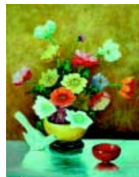
Halina Konopacka (1900-1989) „Kompozycja kwiatowa”, lata 60. XX wieku, olej/płótno/ tektura, 35 x 45 cm.

Prace namalowane przez Halinę Konopacką – złotą medalistkę olimpijską z 1928 r.: „ Kompozycja kwiatowa ”, olej/płótno, 45x35 cm i „ Pejzaż egzotyczny ”, tempera/karton, 43x33 cm, obrazy powstały w latach 60. XX w. oraz liczne książki i archiwalia.