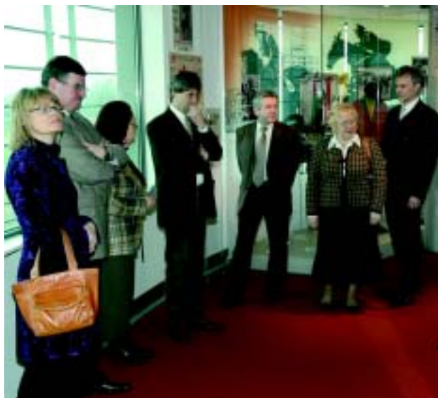
Władze Dzielnicy Żoliborz zwiedzają ekspozycję muzeum.

Goście zapewnili, że w miarę swoich kompetencji i możliwości włączą się w działania podejmowane przez Muzeum Sportu i Turystyki w Warszawie.