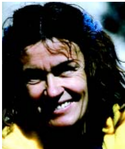
Wanda Rutkiewicz 1943-1992