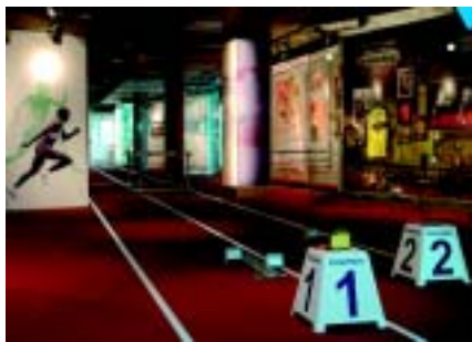
Wyczynowy sprzęt lekkoatletyczny firmy Polanik wykorzystany do aranżacji ekspozycji stałej.

Sprzęt lekkoatletyczny współczesny, wyczynowy: oszczepy, kule, młoty, płotki, bloki startowe, komplet pałeczek sztafetowych – 27 poz. inw.