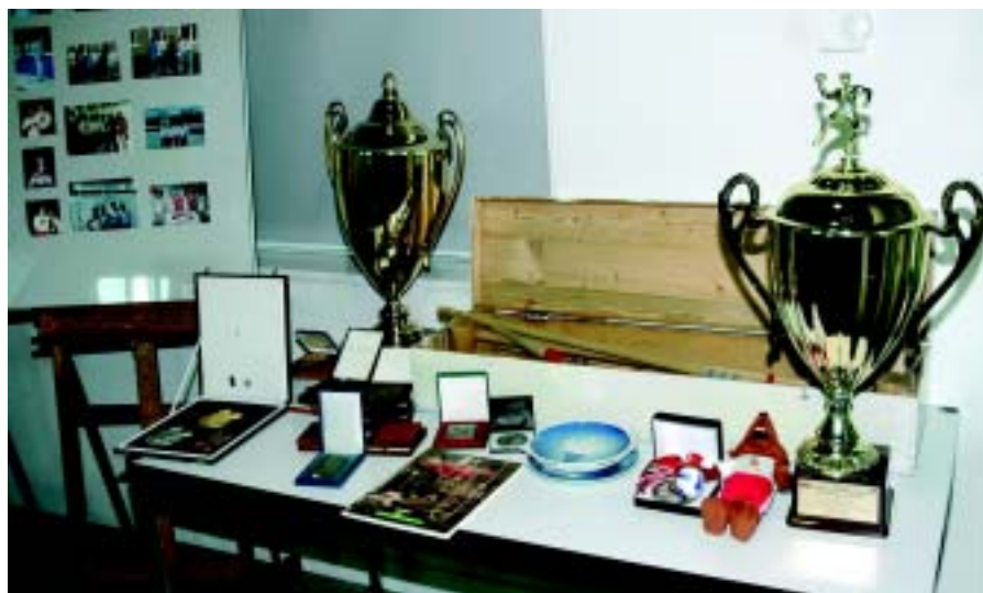
Dary przekazane do zbiorów MSiT podczas ostatniego spotkania darczyńców.

Spotkanie, które przebiegało w bardzo przyjemnej atmosferze – zakończyły towarzyskie rozmowy przy kawie. Wszystkim Darczyńcom bardzo serdecznie dziękujemy i nie ukrywamy, że liczymy na kolejne dary także w latach następnych. Następne spotkanie z Darczyńcami planujemy za dwa lata.