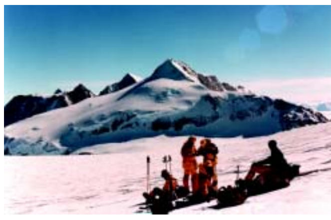
Wyprawa na Mt. Vinson

Znaczna część programu tegorocznego Przeglądu (filmy, pokazy slajdów) skupi się na tych zagadnieniach. Jak zawsze planujemy też bloki filmów: