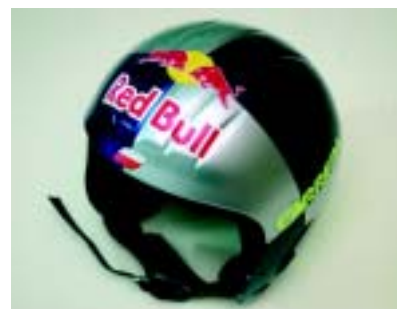
Kask ochronny (Carrera) do skoków narciarskich używany przez Adama Małysza.

Kompletny strój skoczek narciarskiego (kombinezon i rękawice firmy Adidas, kask firmy Carrera, gogle firmy Casco) oraz narty skokowe firmy Fischer używane przez Adama Małysza .